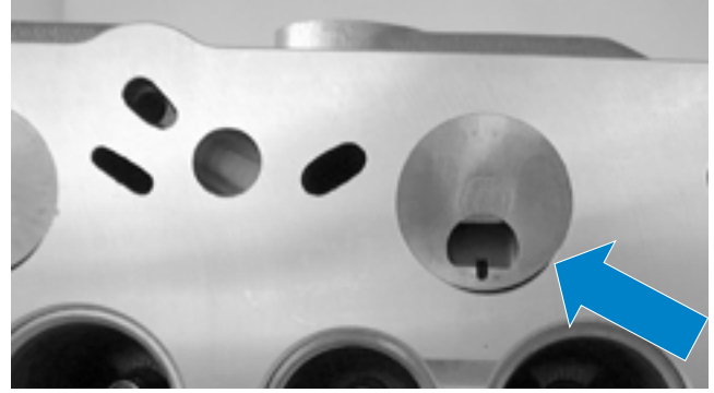
Şek. 1 Monte edilmiş türbülans odası elemanlı silindir kapağı

Türbülans odalı silindir kapaklarında sorunlar, genelde motorun aşırı ısınması, hatalı onarımlar veya silindir kapaklarının yanlış kullanımı sonucu ortaya çıkar. Aşağıda birkaç sıkça sorulan soru cevaplanmıştır.